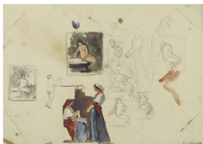
Divers croquis, entre 1859 et 1864 Crayon noir et gouache sur papier. JJHD 880