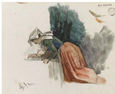
Italiennes, entre 1859 et 1864 Crayon graphite, gouache et encre brune sur papier. JJHD 51 A et B