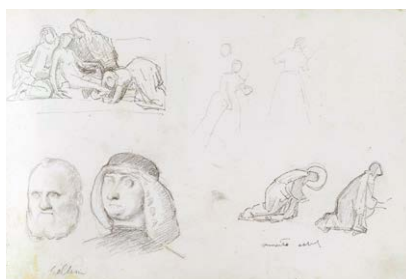
Carnet de dessins réalisé à Florence, vers 1860 Crayon graphite sur papier. JJHD C5