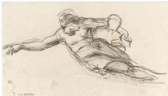
La Création d'Adam (détail) à la chapelle Sixtine, d'après Michel Ange, entre 1859 et 1864 ?

Crayon graphite sur papier. JJHD 25