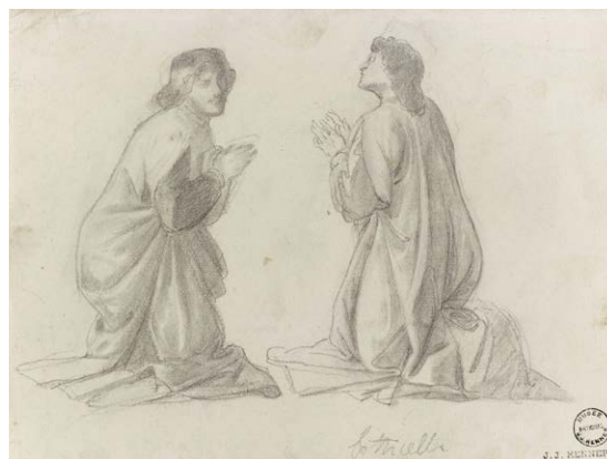
Deux personnages agenouillés, d'après Botticelli, Florence, 1860

Fusain et encre brune sur papier bleu. JJHD 26