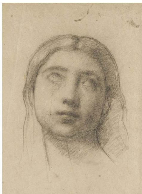
Étude pour Mère suppliant sa fille en prison de renoncer à ses sentiments de chrétienne, 1861

Il consacre une partie importante de son temps à ses « envois » à Paris, qui doivent témoigner de son travail. Il prépare Le Christ en prison (1861, Colmar, musée d'Unterlinden) ou Jeune baigneur endormi (1862, Colmar, musée d'Unterlinden) mais aussi à des projets qu'il ne concrétisera pas comme Mère suppliant sa fille en prison de renoncer à ses sentiments de chrétienne .