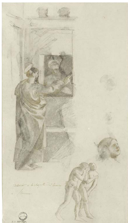
Saint Paul visite saint Pierre dans sa prison et Adam et Ève, d'après Masaccio et Filippo Lippi. Église del Carmine, Florence, 1860