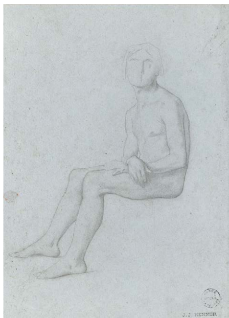
Étude pour Le Christ en prison, envoi de 1861, 1860-1861

Crayon graphite sur papier vélin bleu. JJHD 35