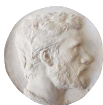
Henri Chapu Léon Bonnat , 1858 Plâtre. JJHS 14