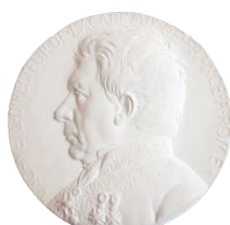
Jules Clément Chaplain Jean Victor Schnetz, 1864 Plâtre. JJHS 10