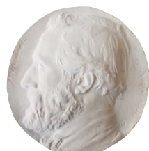
Henri Chapu Pierre De Coninck , 1861 Plâtre. JJHS 12