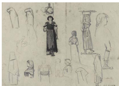
Italiennes, entre 1858 et 1864 Crayon graphite et Carré Conté sur papier. JJHD 717

Il écrit à Charles Gutzwiller : « Figurez-vous ces villages si pittoresques où les vieilles femmes, les jeunes filles, les enfants et tous semblent être faits exprès pour être peints. Les plus pittoresques d'entre elles, et elles, se connaissant en pittoresque, viennent vers vous quand elles vous voient avec une boîte à couleurs et vous disent : 'Signor, volete ritrar-mi.', c'est-à-dire, voulez-vous faire mon portrait. Elles ne demandent pas mieux ; quand vous dessinez des maisons et des monuments, elles se mettent exprès à côté dans des poses si gracieuses et si belles, qu'on en oublie presque que le gouvernement vous envoie pour faire de la peinture d'histoire ».