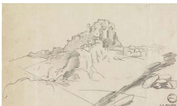
Castel Fusano, dîner des nouveaux, entre 1859 et 1864

Crayon graphite et aquarelle sur papier vélin crème. JJHD 61