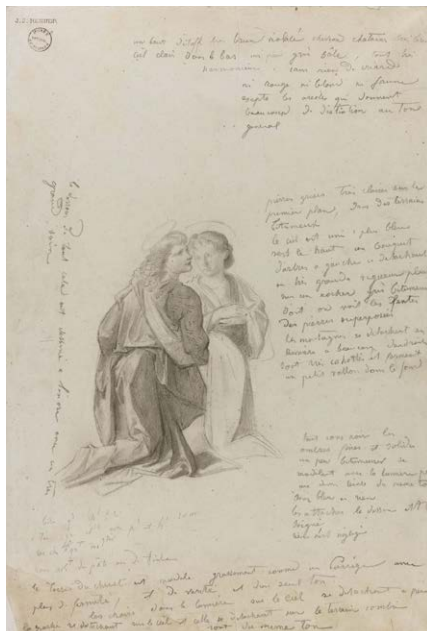
Deux Anges, d'après Le Baptême de Jésus-Christ de Verrochio, 1860

Crayon graphite sur papier. JJHD 25