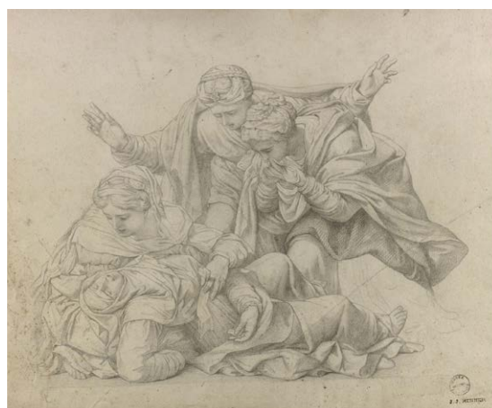
Évanouissement de la Vierge. Descente de croix d'après Daniele de Volterra, entre 1859 et 1864