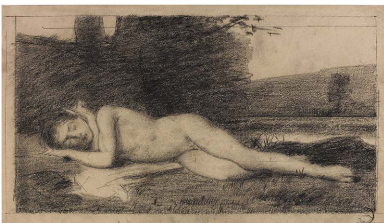
Jeune baigneur endormi, envoi de 1862, après 1862